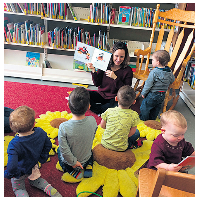
L'heure du conte à la bibliothèque de Wakefield le 27 février