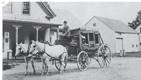
Diligence arrêtée à l'hôtel Moore, Chelsea, QC vers 1885

Cette exposition met en lumière l'énergie humaine, la force animale et les moyens mécaniques déployés au fil des siècles pour le transport des gens et des marchandises dans la vallée de la Gatineau.