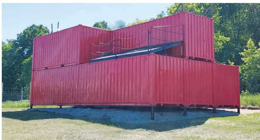
Centre de formation des pompiers à Wakefield

répondants ont déjà répondu à 29 appels avec un temps de réponse très intéressant. Étant déjà sur place, ils arrivent très rapidement sur les lieux d'une intervention pour fournir les premiers soins aux victimes en attendant l'arrivée du service ambulancier.