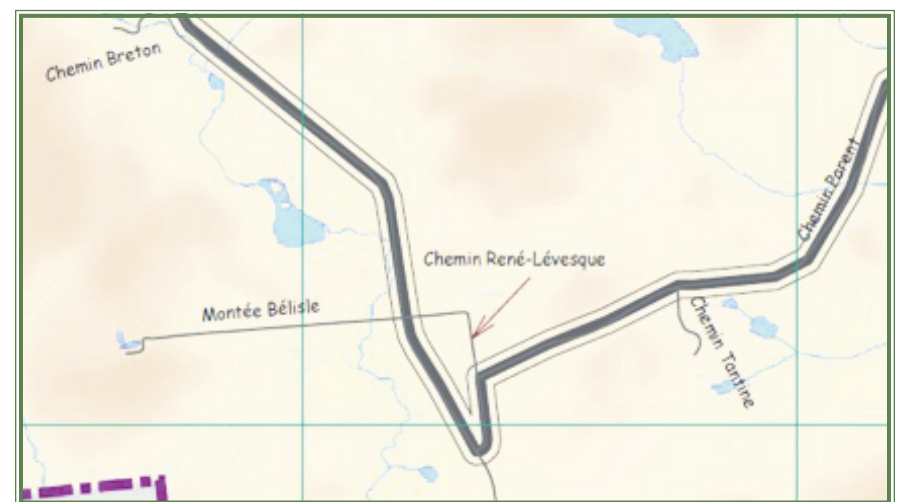
Extrait de la carte routière avec le bon tracé du Club Quad pour le chemin René-Lévesque

La Municipalité s'excuse pour tout désagrément que cette erreur aurait pu engendrer.